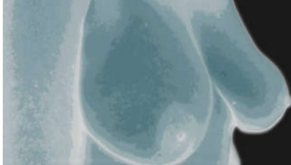
Mit dem Hashtag #saggyboobsmatter protestieren derzeit viele Frauen gegen den Schönheitswahn in den sozialen Netzwerken.